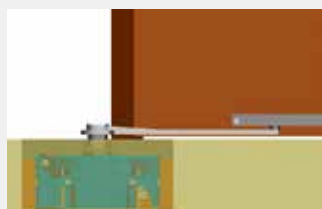
Haste de puxar