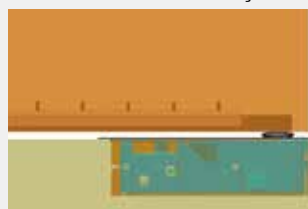
Com braço da porta integrado