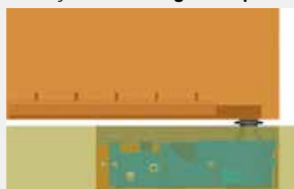
Com braço da porta integrado